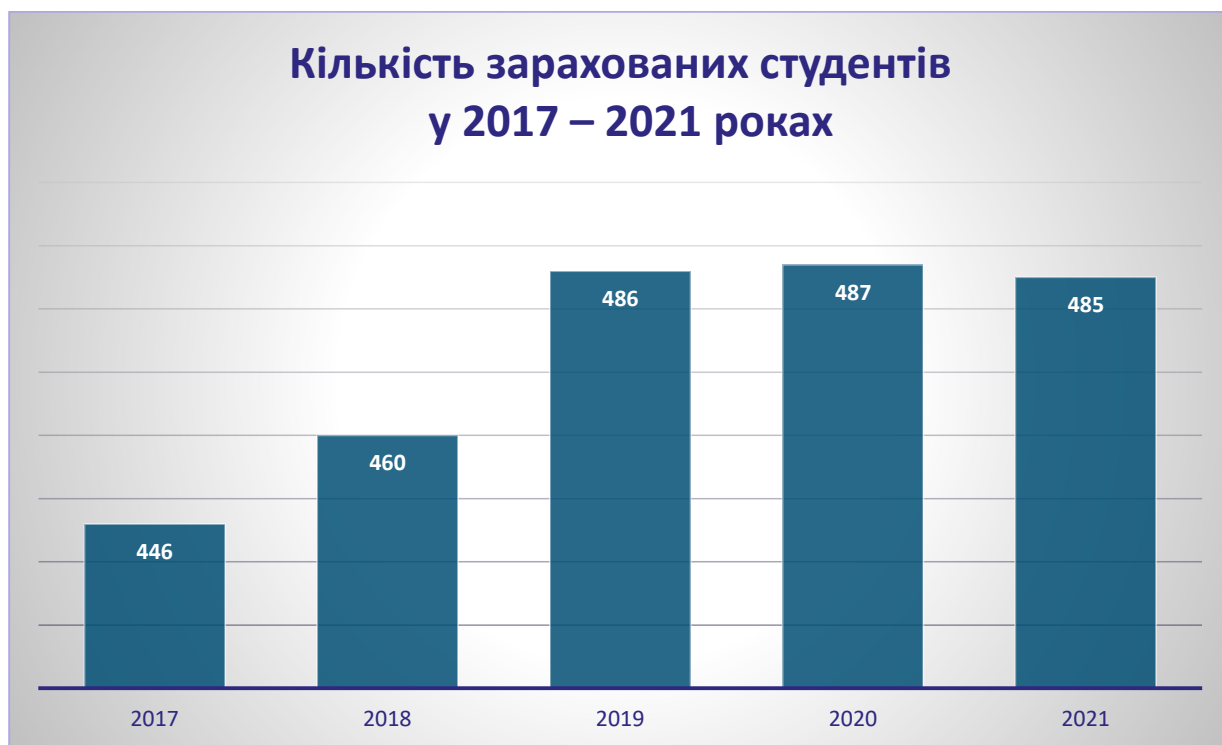
Рис. 3.3 – Динаміка зарахованих осіб у 2017-2021 роках

Результати роботи Приймальної комісії у 2021 році досить високі. Починаючи з 2018 року, коледж заповнює весь ліцензований обсяг за денною формою навчання. Так, у 2021 році за денною формою навчання зараховано 413 абітурієнтів, із них за державним бюджетом – 191 особа. За заочною формою навчання зараховано 72 абітурієнти, 31 – за державним замовленням. На поданому графіку можна побачити динаміку зарахованих студентів у 2017 – 2021 роках.