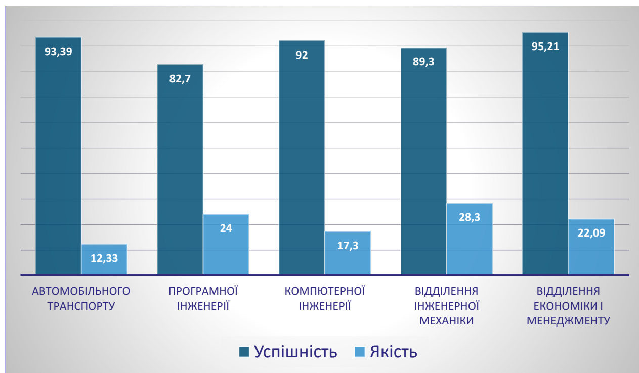
Рис.4.3 – Показники якості та успішності по відділеннях (у %) у 2020-2021 н. р.

Відповідно до процедур системи внутрішнього забезпечення якості освітньої діяльності у коледжі в 2021 році проведено аналіз роботи відділень у вигляді розрахунків якості та успішності здобувачів освіти. У 2020 – 2021 навчальному році успішність складає 90,5% при якісному показнику 20,8% (рис.3.4).