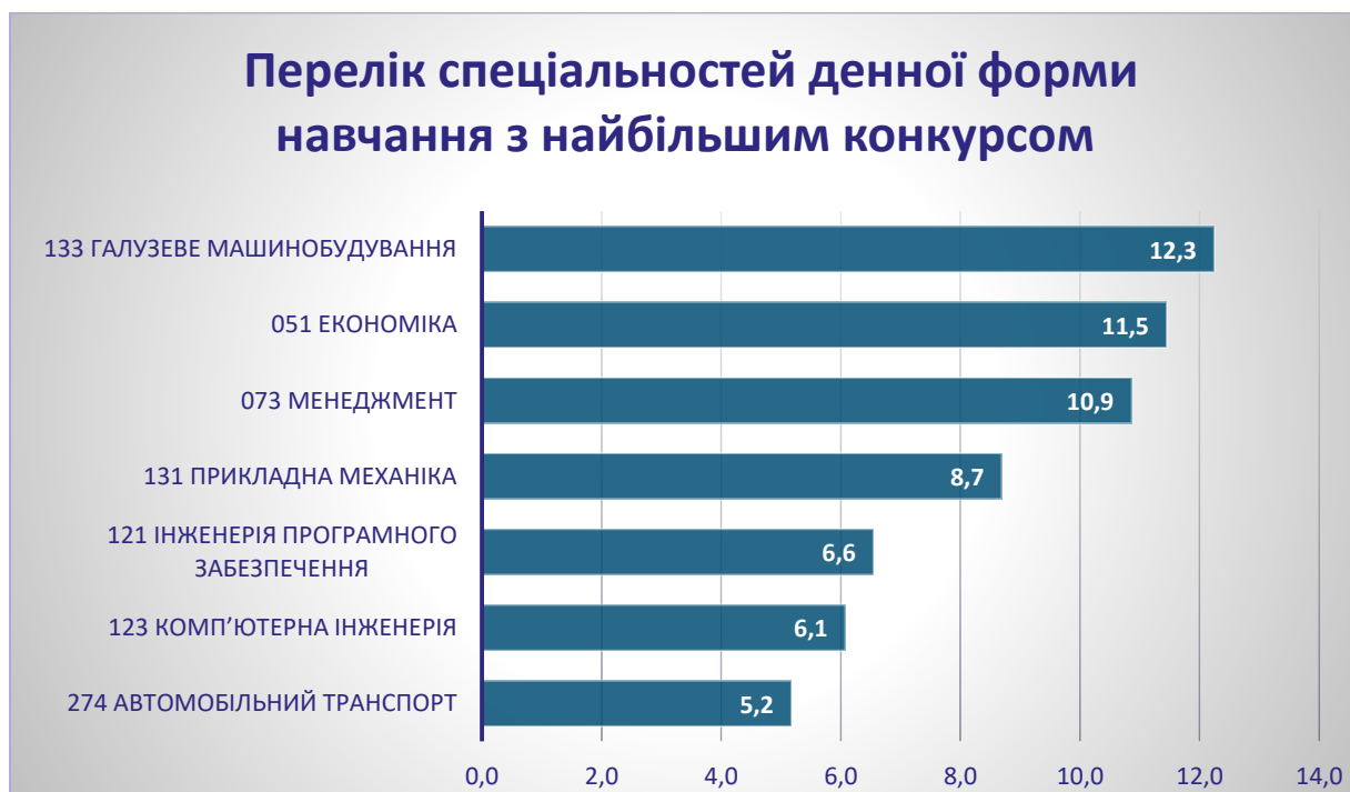
Рис. 3.2 – Конкурс на місця державного замовлення

Загальний конкурс за поданими заявами на одне місце державного замовлення становив 7,4 (у 2020 році – 6,5) для денної форми навчання. Перелік спеціальностей денної форми навчання з найбільшим конкурсом за поданими заявами на одне місце державного замовлення наведено у графіку нижче.