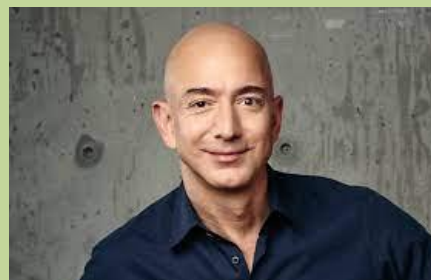
Джефф Безос, засновник і голова Amazon