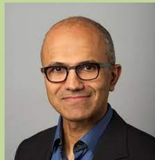
Сатья Наделла, американський топ- менеджер, голова Microsoft